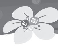
ตารางที่ 3 (ต่อ)