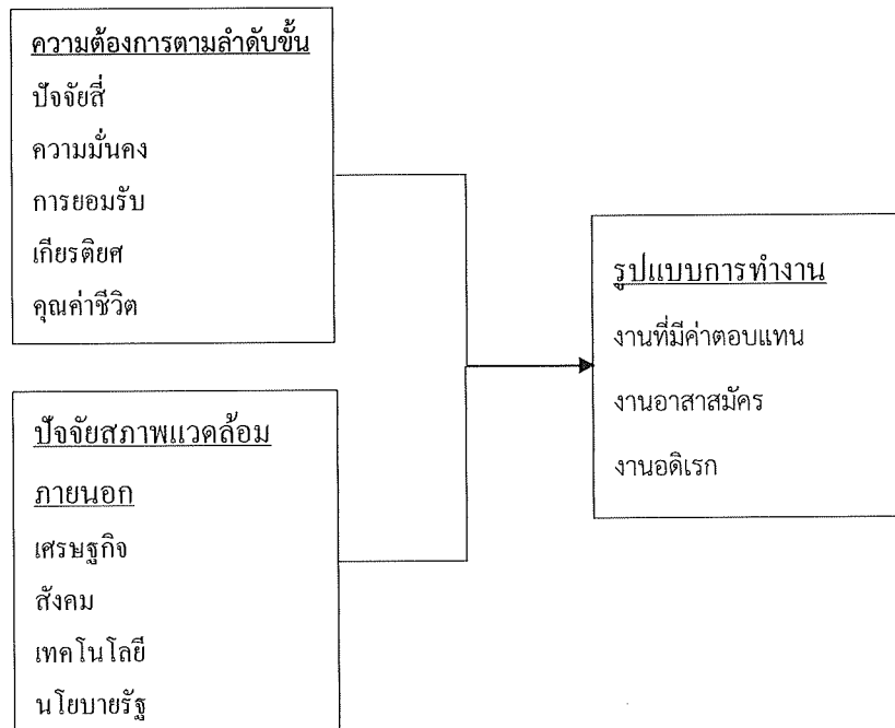
ภาพที่ 1 กรอบแนวคิดงานวิจัย