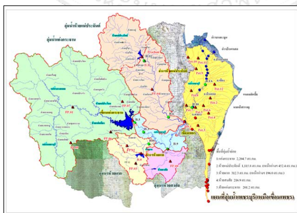
ภาพที่ 1 แผนที่ลุ่มน้ำเพชรบุรีบริเวณเหนือเขื่อนเพชร

น้ำเพชรบุรีบริเวณเหนือเขื่อนเพชร มีพื้นที่รวมทั้งสิ้น 4,050.9 ตารางกิโลเมตร เป็นพื้นที่เหนือเขื่อนเก็บน้ำแก่งกระจาน, อ่างเก็บน้ำห้วยผาก และอ่างเก็บน้ำห้วยแม่ประจันต์ 2,853.1 ตารางกิโลเมตรและเป็นพื้นที่ท้ายอ่างเก็บน้ำทั้ง 3 แห่ง 1,197.8 ตารางกิโลเมตรซึ่งสามารถบริหารจัดการน้ำจากฝนที่ตกหนักได้เฉพาะพื้นที่บริเวณเหนืออ่างฯ แต่พื้นที่บริเวณท้ายอ่างฯ ไม่สามารถทำได้ โดยเฉพาะในพื้นที่ลุ่มน้ำห้วยแม่ประจันต์ เป็นสาเหตุให้เกิดอุทกภัยในครั้งนี้มีพื้นที่เหนืออ่างฯ 452.4 ตารางกิโลเมตรพื้นที่ท้ายอ่างฯ 663.4 ตารางกิโลเมตร เมื่อมีฝนตกหนักในพื้นที่ท้ายอ่างฯ จะทำให้เกิดน้ำป่าไหลหลากลงมาที่เขื่อนเพชรอย่างรวดเร็ว เขื่อนเพชรซึ่งเป็นเขื่อนทดน้ำไม่สามารถเก็บน้ำไว้ได้ น้ำหลากดังกล่าวก็จะไหลล้นข้ามเขื่อนเพชรลงสู่แม่น้ำเพชรบุรี ทำให้เกิดอุทกภัยในพื้นที่ตอนล่างตั้งแต่ อำเภอท่ายาง อำเภอบ้านลาด อำเภอเมืองเพชรบุรี และอำเภอบ้านแหลม จังหวัดเพชรบุรี ดังแสดงในภาพที่ 1 (โครงการส่งน้ำและบำรุงรักษาเพชรบุรี (เขื่อนเพชร), 2561)