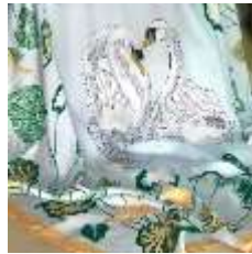
ภาพที่ 4 ลายดอกโป๊ยเซียน