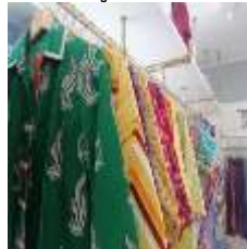
ภาพที่ 13 เสื้อคลุม แขนยาว