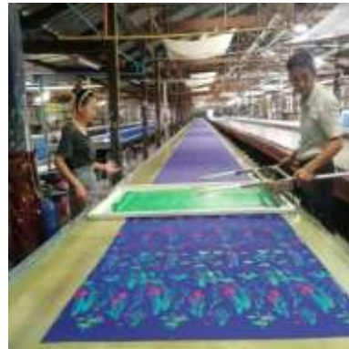
ภาพที่ 2 การคาดสี