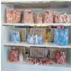
ภาพที่ 12 เซตกระเป๋า อเนกประสงค์

เดิมโรงงานผ้าไหมพัสตร์จะผลิตผ้าไหมพัสตร์ชนิดเดียวคือ ผ้าชั้น ซึ่งผ้าชั้นคือผ้าผืนขนาดใหญ่ที่ทางร้านขายเป็นหลา ต่อมาเมื่อความต้องการของลูกค้าเปลี่ยนไปตามยุคสมัย ร้านไหมพัสตร์จึงสร้างผลิตภัณฑ์จากผ้าไหมพัสตร์เพิ่มขึ้นเพื่อตอบสนองความต้องการและเพื่อสร้างทางเลือกให้กับลูกค้า เป็นผลิตภัณฑ์ที่ตัดเย็บสำเร็จ เช่น กระเป๋า เสื้อสุภาพบุรุษและสุภาพสตรี ตุ๊กตา หมวก และยังมี การจัดเซตผลิตภัณฑ์เพื่อดึงดูดความสนใจลูกค้าในโอกาสสำคัญต่าง ๆ เช่น เซตวันวาเลนไทน์ เป็นต้น