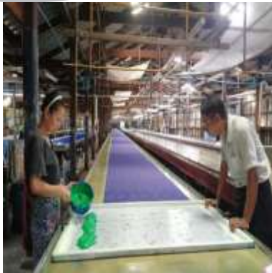
ภาพที่ 1 ตักสีลงกล่องพิมพ์