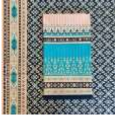
ภาพที่ 3 ลายพระเกี้ยว

เกี้ยว ซึ่งเป็นลายของเครื่องทรงรัชกาลที่ 4 และลายไทยอื่น ๆ เช่น ลายหนุมาน ลายดอกไม้ไทย ลายวัด ลายชานา ลายบ้านทรงไทย ลายผีเสื้อ ลายปลา ลายหัวโขน ลายแดงโม ลายใบไม้ ลายไข่มพัสตร์ เป็นต้น