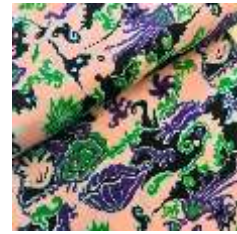
ภาพที่ 11 ลายสะดือทะเล