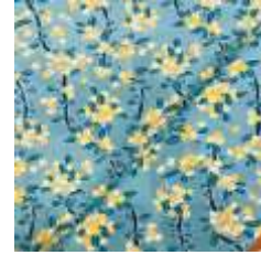
ภาพที่ 5 ลายหงส์บนใบบอน