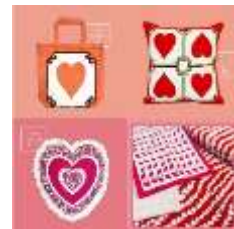
ภาพที่ 14 เซตวันวาเลนไทน์