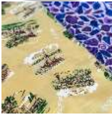
ภาพที่ 9 ลายตลาดฉัตรไชยและ ทะเลหัวหิน ที่มา เพจ Khomapastr Fabrics