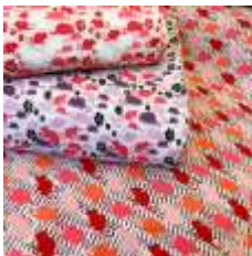
ภาพที่ 6 ลายปีชวด

ลายประยุกต์เป็นลายที่ออกแบบให้มีความทันสมัยมากขึ้น โดยจะประยุกต์ให้เข้ากับสถานการณ์ในปัจจุบัน และเหตุการณ์ต่าง ๆ ในรอบปี ในการออกแบบลายประยุกต์นั้นจะมีทั้งการนำลายไทยที่มีอยู่แล้ว มาเพิ่มเติมหรือออกแบบให้เป็นที่ดึงดูดและมีความน่าสนใจมากขึ้นกว่าลายไทยธรรมดา อีกทั้งยังมีการออกแบบลายขึ้นมาใหม่เพื่อปรับให้เข้ากับกลุ่มลูกค้าทุกเพศ ทุกวัย เช่น ลายประจำปีนักษัตร ลายชุดประชาชาติของอาเซียน ลายดอกไม้เมืองหนาว ฯลฯ