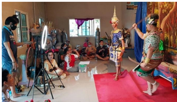
ภาพที่ 3 เบื้องหลังการแสดงละครชาตรีในรูปแบบการถ่ายทอดสดทางหน้าเพจของเฟซบุ๊ก