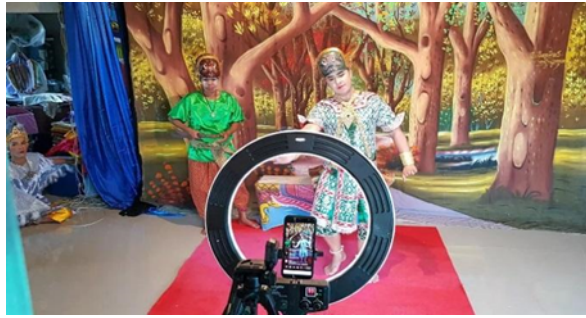
ภาพที่ 2 การแสดงละครชาตรีในรูปแบบการถ่ายทอดสดทางหน้าเพจของเฟซบุ๊ก ที่มา : ไทยรัฐออนไลน์ (18 พ.ค. 2563)