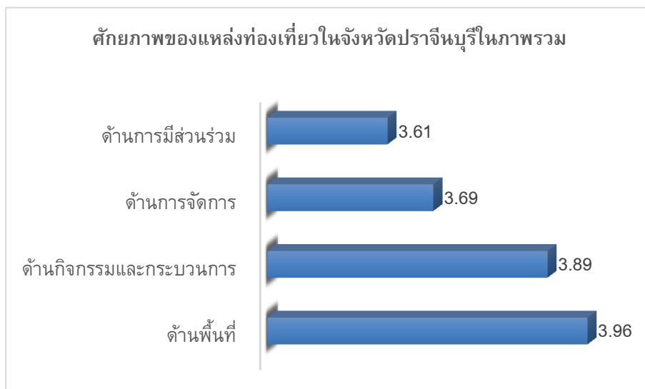
ภาพประกอบที่ 1: แสดงค่าเฉลี่ยของศักยภาพของแหล่งท่องเที่ยวในจังหวัดปราชญ์บุรีในภาพรวม

เมื่อพิจารณาเป็นรายด้าน พบศักยภาพของแหล่งท่องเที่ยวที่มีค่าเฉลี่ยสูงสุด คือ ด้านพื้นที่ ( \bar{X} = 3.96 ) รองลงมา คือ ด้านกิจกรรมและกระบวนการ ( \bar{X} = 3.89 ) ด้านการจัดการ ( \bar{X} = 3.69 ) และด้านการมีส่วนร่วม ( \bar{X} = 3.61 ) อยู่ในระดั้มากตามลำดับ