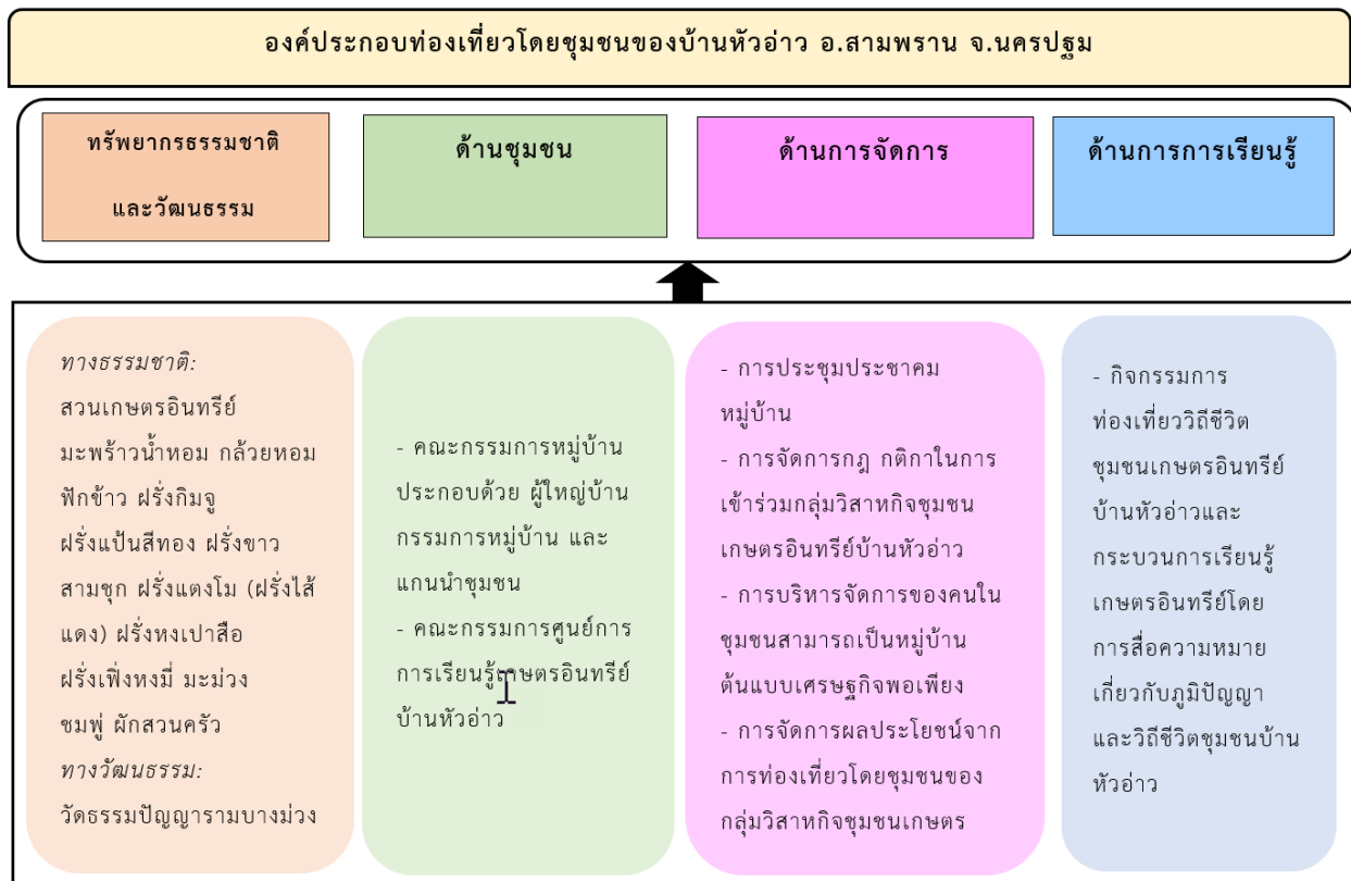
ภาพที่ 1 องค์ประกอบการท่องเที่ยวโดยชุมชนบ้านหัวอ่าว อำเภอสามพราน จังหวัดนครปฐม

จากผลการวิจัยสามารถแสดงเป็นภาพองค์ประกอบได้ดังนี้