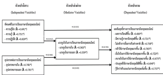
ภาพที่ 2: ผลการศึกษาปัจจัยเชิงสาเหตุของทัศนคติอุปสรรค ที่ส่งผลต่อแรงจูงใจและส่งผลต่อผลสัมฤทธิ์ทางการเรียนภาษาอังกฤษออนไลน์ในรายวิชาภาษาอังกฤษกลุ่มวิชาทางการท่องเที่ยวและการโรงแรม (ที่มา: ผู้วิจัย)