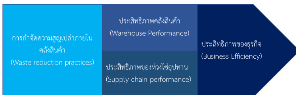
ภาพที่ 3 องค์ความรู้ใหม่จากการวิจัย

จากการวิจัยทำให้เกิดองค์ความรู้ใหม่ ซึ่งเป็นกระบวนการเพิ่มประสิทธิภาพธุรกิจ ดังแผนภาพที่ 3