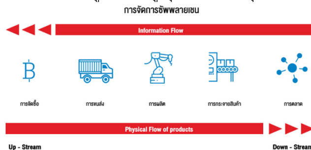
ภาพที่ 1 การจัดการห่วงโซ่อุปทาน

การจัดการห่วงโซ่อุปทาน เป็นการเรียงลำดับตามขั้นตอนของกระบวนการทั้งกระบวนการที่ทำให้สามารถสร้างความพึงพอใจให้กับลูกค้าได้ โดยเริ่มตั้งแต่ต้นน้ำ (Upstream) จน ถึงปลายน้ำ (Downstream) ซึ่งได้แก่ กระบวนการจัดซื้อจัดจ้าง (Procurement and Sourcing) การผลิต (Manufacturing) การจัดเก็บ (Warehousing) การใช้เทคโนโลยีสารสนเทศ (Information Technology) การกระจายสินค้า (Distribution) และการขนส่ง (Transportation) ซึ่งกระบวนการเหล่านี้จะต้องทำดำเนินงานด้วยความสอดคล้องและไปในทิศทางเดียวกันเพื่อความคล่องตัวในการดำเนินงาน การจัดการห่วงโซ่อุปทาน ไม่ได้เป็นการจัดการเฉพาะแผนกหรือหน่วยงานต่างๆ ภายในองค์กรเท่านั้น แต่การบริหารจัดการจะต้องคำนึงถึงองค์กรอื่นๆ ภายนอกบริษัทที่จะต้องสร้างความสัมพันธ์การติดต่อประสานงานอย่างเป็นระบบและมีประสิทธิภาพ องค์กรภายนอกที่สำคัญ การจัดการห่วงโซ่อุปทาน จึงเป็นสิ่งสำคัญต่อการดำเนินธุรกิจ ซึ่งองค์กรที่อยู่ในห่วงโซ่อุปทาน สามารถสร้างความได้เปรียบในการแข่งขัน โดยการร่วมกันพัฒนาเครือข่ายความร่วมมือในการดำเนินงานผ่านฐานข้อมูลหลักที่องค์กรต่างๆนำมาแบ่งปันกัน เพื่อที่ตอบสนองต่อความต้องการของลูกค้าให้ได้สูงสุดซึ่งสามารถสรุปได้ตามภาพ ที่ 1