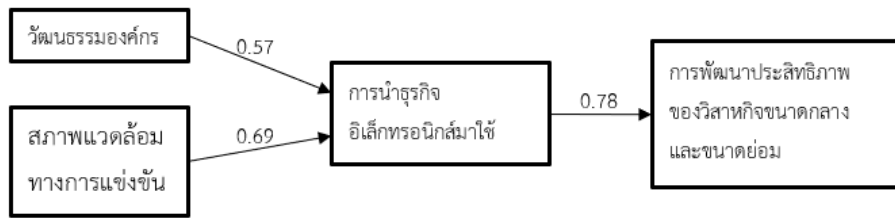
ภาพประกอบที่ 2 แสดงค่าสัมประสิทธิ์ถดถอยปรับมาตรฐานระหว่างตัวแปร