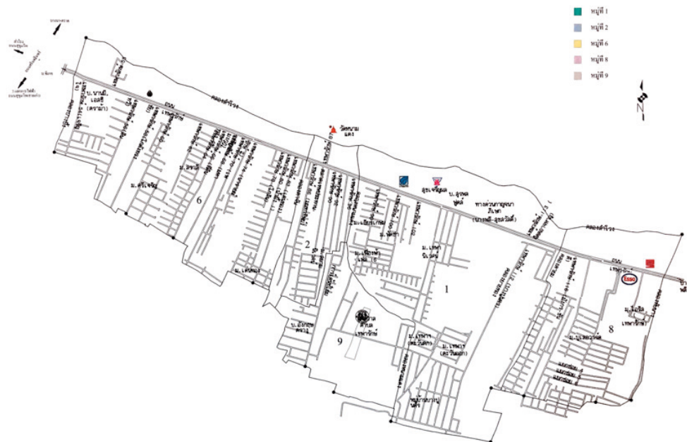
Figure 1 Map of the community of Thepharak subdistrict municipality

เทศบาลตำบลเทพารักษ์ จึงต้องอาศัยวัดหนามแดงเป็นศาสนสถานประกอบพิธีกรรมและแหล่งรวมอารยธรรมที่สำคัญของประชาชนทั้ง 2 ตำบล มีรายละเอียดที่ปรากฏรายละเอียดตามแผนที่ดังภาพที่ 1