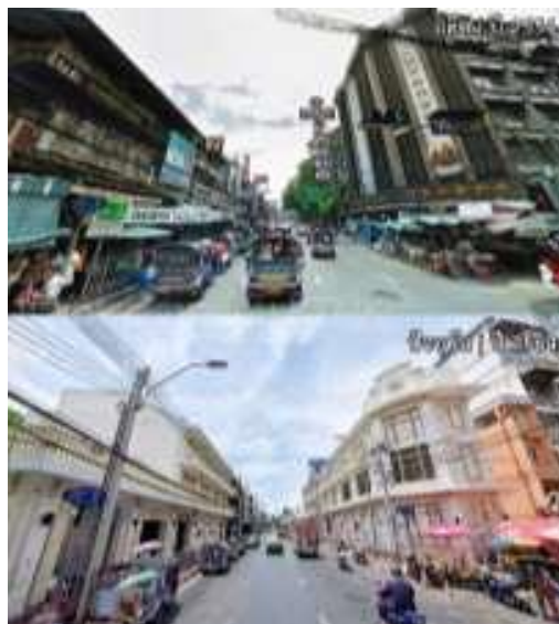
ภาพที่ 2 แผนที่ MRT สถานีวัดมังกร

ปัญหาโครงสร้างพื้นฐาน บริการทางการท่องเที่ยว ตรอกเจริญไชยอยู่ใกล้สถานีรถไฟฟ้าใต้ดิน ทำให้ทราบว่าแรงกดดันจากการพัฒนาสมัยใหม่ การเข้ามาของรถไฟฟ้าส่งผลให้ชุมชนเจริญไชยที่เป็นหนึ่งในชุมชนเก่าแก่ที่ตั้งอยู่บริเวณนั้นได้รับผลกระทบจากการสร้างสถานีรถไฟฟ้าใต้ดินสถานีวัดมังกร ตึกเก่าอายุกว่าร้อยปีถูกเรียกคืนเพื่อใช้ประโยชน์ในการก่อสร้างอาคารขึ้น-ลงสถานีรถไฟฟ้าใต้ดิน การค้าขายช่วงที่มีการก่อสร้างซบเซาลงไปมาก ระบบการระบายน้ำไม่ดีเหมือนแต่ก่อน ท่อระบายน้ำเกิดการอุดตัน จุดจอตลอดส่วนบุคคลมีจำนวนค่อนข้างน้อยหรือมีอัตราค่าจอตลอดค่อนข้างแพง รวมไปถึงห้องน้ำสาธารณะมีจำนวนน้อยและไม่ถูกสุขลักษณะอนามัย