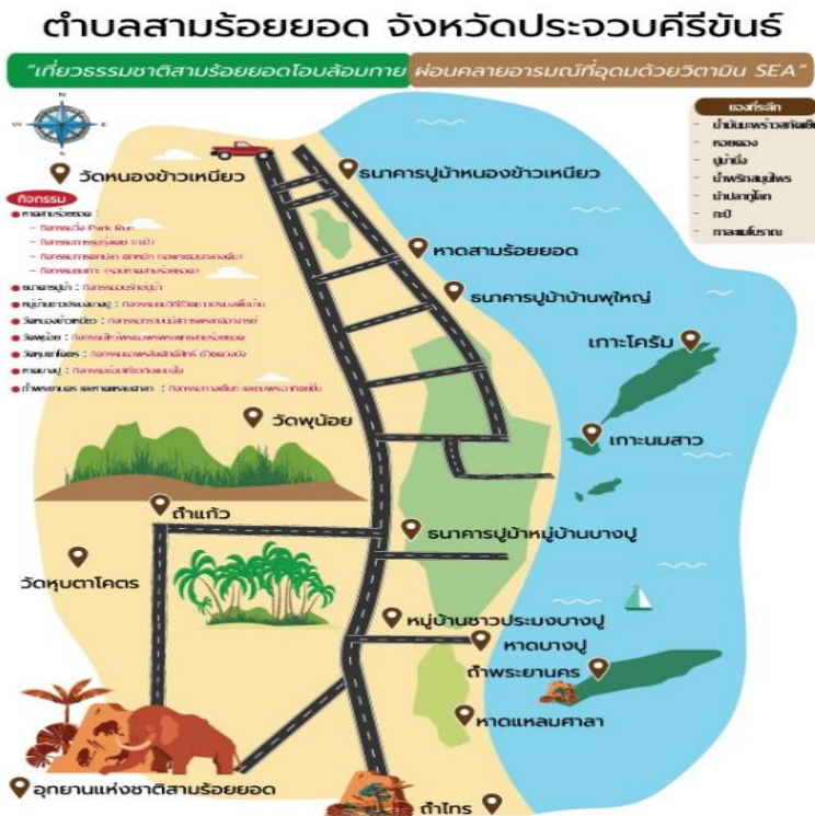
ภาพที่ 2 เส้นทางกรุงเทพ-ปราณบุรี-แม่น้ำปราณบุรี-หาดแหลมศาลา-ถ้ำพระยานครอุทยานราชภัฏ-วัดหัวมวงมดล (นรินทร์ สังข์รักษา และคณะ, 2564)

2. ผลการจัดทำเส้นทางและทดลองเส้นทางการท่องเที่ยวเชิงนิเวศของตำบลสามร้อยยอด อำเภอสามร้อยยอด จังหวัดประจวบคีรีขันธ์ คณะนักวิจัยได้จัดทำเส้นทางทั้งระยะสั้น 2 วัน 1 คืน และระยะยาว 3 วัน 2 คืนและทดลองเส้นทางท่องเที่ยวเชิงนิเวศของตำบลสามร้อยยอด อำเภอสามร้อยยอด จังหวัดประจวบคีรีขันธ์ ซึ่งได้สำรวจเส้นทาง มีกิจกรรมที่หลากหลาย ซึ่งผ่านการพิจารณาจากคนในพื้นที่ และการทดลองจริงโดยมีกิจกรรมเชิงอนุรักษ์ท่องเที่ยวมาทดสอบเป็นที่พึงพอใจในระดับมาก ดังแผนภาพที่ 2