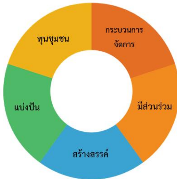
แผนภาพที่ 1 กรอบแนวคิดเศรษฐกิจ ชุมชนท่องเที่ยวบ้านถ้ำเสือ

จากการวิจัยทำให้เกิดองค์ความรู้ ซึ่งเป็นกระบวนการพัฒนาการดำเนินงาน ไปสู่ปัจจัยความสำเร็จของวิสาหกิจชุมชนท่องเที่ยวบ้านถ้ำเสือ จ.กระบี่ โดยการนำกรอบแนวคิดเศรษฐกิจพอเพียง เป็นกรอบในการดำเนินงานท่องเที่ยว ทำให้ความเป็นชุมชนดั้งเดิมยังถูกรักษาไว้ และยังสามารุคประยุกต์พัฒนาให้ทันสมัย ทำให้เกิดการพัฒนารท่องเที่ยวที่ยั่งยืน ดังแผนภาพที่ 1