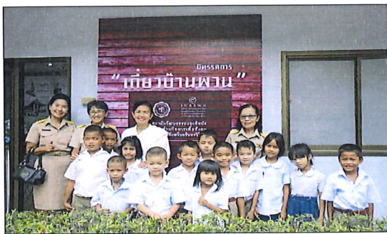
ภาพที่ 3 โรงเรียนในพื้นที่นำนักเรียนมาศึกษาเรียนรู้ ณ พิพิธภัณฑ์ชุมชน ที่มา : สถาบันวัฒนธรรมและศิลปะ มหาวิทยาลัยศรีนครินทรวิโรฒ

เอ็กซ์นำประวัติศาสตร์ชุมชนมาสร้างสรรค์เป็นเรื่องราว เช่น เรื่องเล่าบรรพบุรุษไทยพวนรุ่นแรกที่อยู่พามาตั้งถิ่นฐานและพัฒนาพื้นที่แห่งนี้ให้เป็นพื้นที่ทำกิน และที่อยู่อาศัย ณ เมื่อประมาณสองร้อยปีที่แล้ว หลังท่านเสียชีวิตชาวบ้านเชื่อว่าท่านยังคงคอยปกป้องรักษาลูกหลานชาวไทยพวนทุกคนในหมู่บ้าน ชาวบ้านจึงตั้งเป็นศาลบรรพบุรุษ