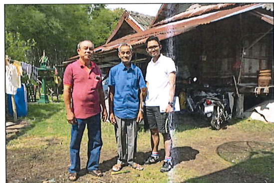
ภาพที่ 2 ผู้วิจัยสัมภาษณ์ผู้ให้ข้อมูลรอง