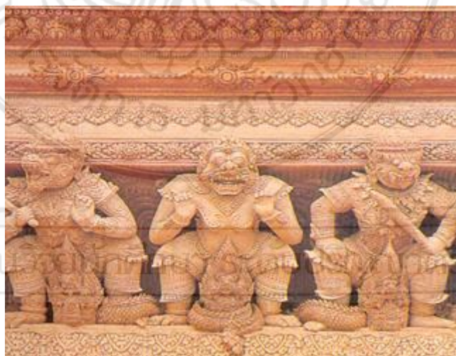
ผลงานคุณทองรุ่งอม โยษฐ ศาลพระพรหม ที่หน้าสถานีรถไฟฟ้าเขาวัง