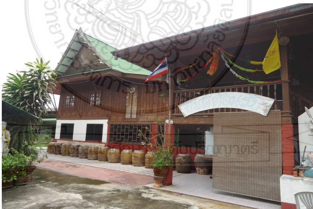
สถานที่ตั้งกลุ่มศิลปะปูนปั้น