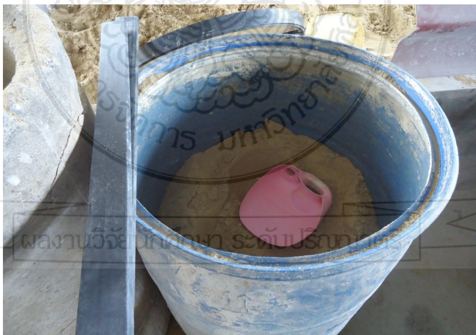
ทรายที่จะนำไปทำปูนปั้น