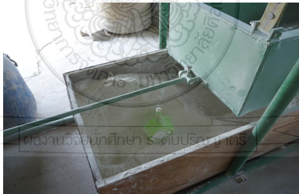
เครื่องร่อนปูน