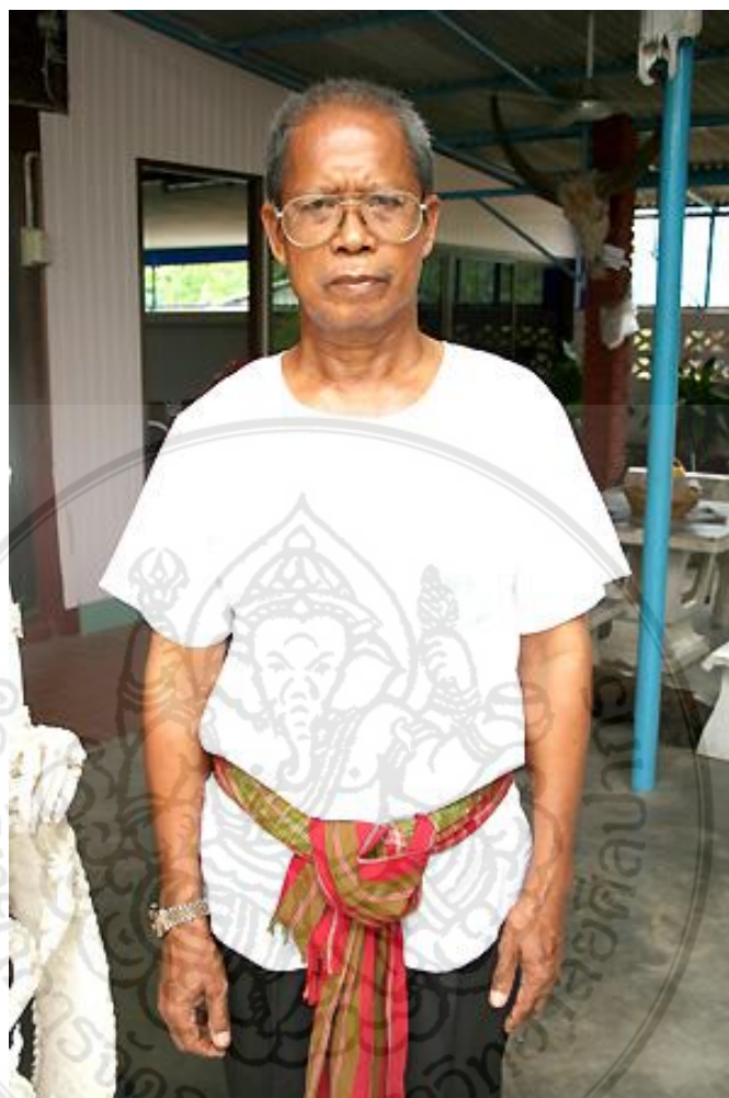
คุณทองร่วง เอ็มโอบุฑู