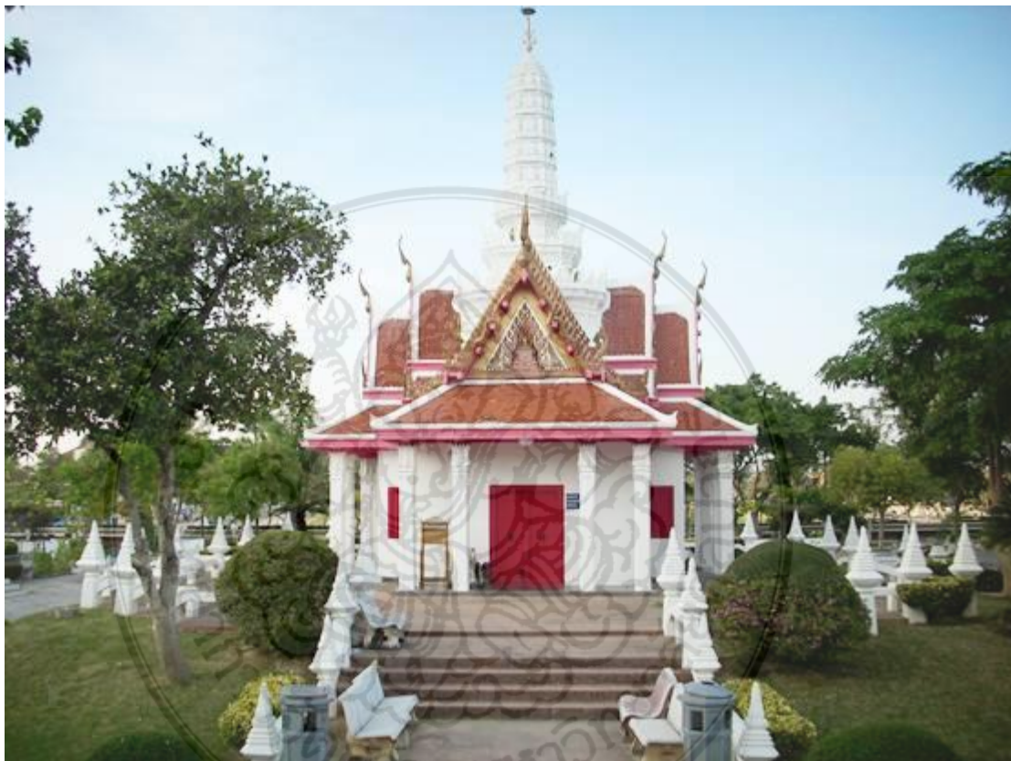
คุณทองรุ่ง เอมโอยฐปิ่นหน้าบันช่อฟ้าใบระกาศาลหลักเมืองจังหวัดเพชรบุรี