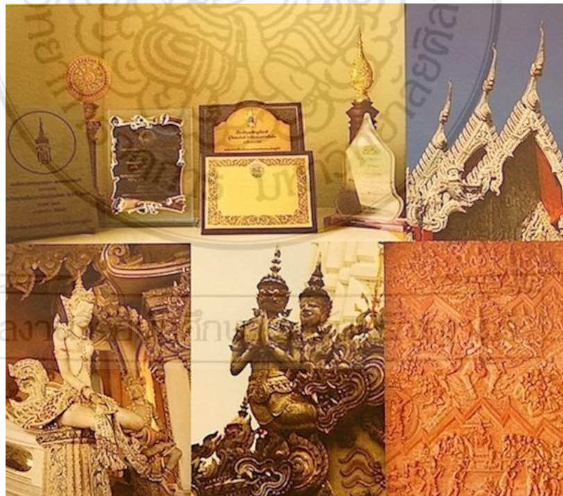
ผลงานต่างๆ ของคุณทองร่วง เอ็มโอบรู