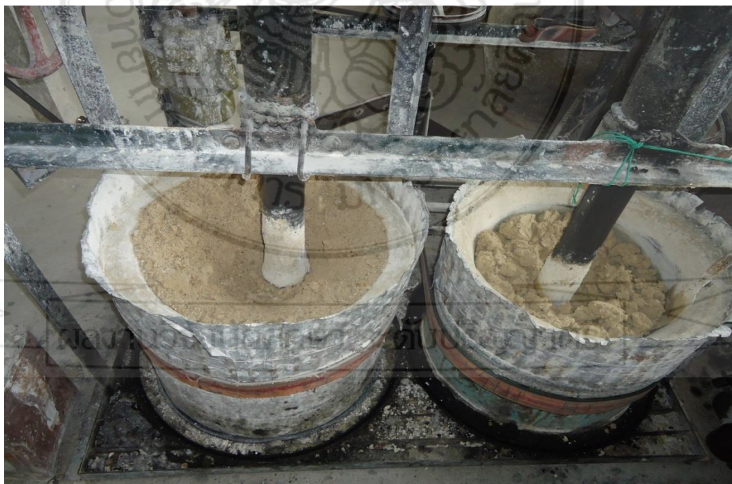
เครื่องตำปุนที่นำมาใช้แทนแรงงานคนเพื่อความเร็วในการทำงาน