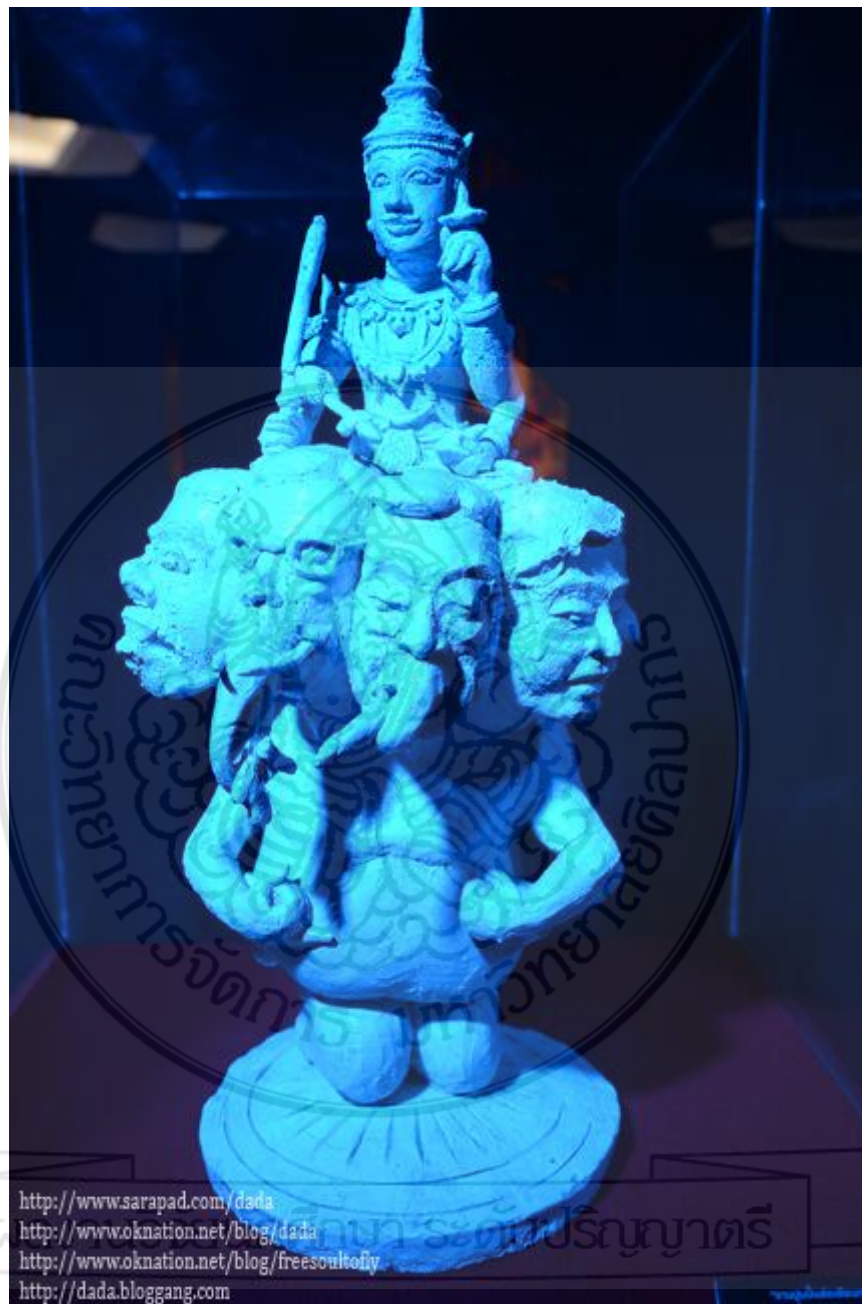
"งานปูนปั้นลือเลื่องการเมือง ฝีมือปั้น ทองร่วง เอมโอยฐู"

ผลงานปูนปั้นของคุณทองร่วงเอมโอยฐูลือเลื่องการเมืองชิ้นนี้สร้างขึ้นเมื่อสมัยพลเอกชวลิตยงใจยุทธดำรงตำแหน่งเป็นนายกรัฐมนตรี (พ.ศ. 2539-2550) ช่างทกเศียรนี้เปรียบเสมือนพรรครัฐบาลและพรรคร่วมรัฐบาลที่ต้องทำงานร่วมกันโดยมีความผูกพันซึ่งในที่นี้ทองร่วงได้ขึ้นเป็นรูปพระนารายณ์อันหมายถึงพระบาทสมเด็จพระเจ้าอยู่หัว