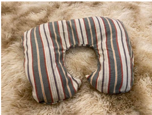
ภาพที่ 1 ผลิตภัณฑ์หมอนรองคอกจากกากกล้วย

นำไปจัดจำหน่ายเพื่อเป็นสินค้า OTOP ได้ หรือนำไปจัดจำหน่ายให้กับผู้ที่สนใจในสินค้าประเภทอนุรักษ์สิ่งแวดล้อมและช่วยส่งเสริมการมีรายได้ภายในชุมชน ทั้งนี้เพื่อตอบสนองของวัตถุประสงค์ของการศึกษาทั้งสองด้านคือ เพื่อศึกษาแนวทางการพัฒนาบรรจุภัณฑ์ผลิตภัณฑ์หมอนรองคอกจากกากกล้วยและวิเคราะห์ต้นทุนการผลิตในการพัฒนาบรรจุภัณฑ์ และเพื่อศึกษาความพึงพอใจของลูกค้าที่มีต่อบรรจุภัณฑ์ผลิตภัณฑ์หมอนรองคอกจากกากกล้วย