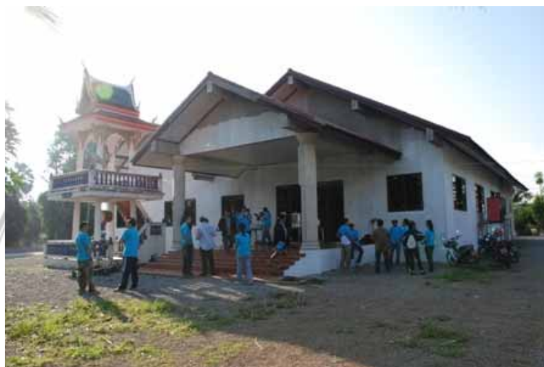
ภาพที่ 16 ศาลาทรงธรรมก่อนทำ

ได้จัดกิจกรรม SSI อาสาครั้งที่ 3 ที่ โรงเรียนอนุบาลบ้านดอนสำราญ อำเภอบางสะพาน ที่บริเวณสนามเด็กเล่น ซึ่งโครงการนี้ได้้นำผู้บริหารและพนักงาน ร่วมกับครู ผู้ปกครอง และชาวบ้านในบริเวณใกล้เคียง อาสาลงมือบูรณะซ่อมแซมอาคารเรียนที่เป็นศาลาทรงธรรม โดยทำการทำความสะอาด ทาสี ติดตั้งฝ้า ติดตั้งพัดลมใหม่ เป็นต้น