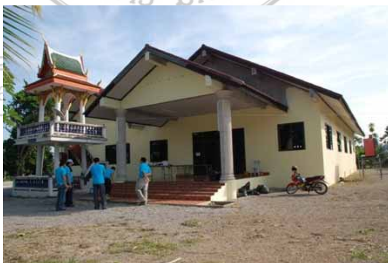
ภาพที่ 17 ศาลาทรงธรรมหลังทำ

เข้าถึงเมื่อ 25 เมษายน 2552. เข้าถึงได้จาก http://www.blogssi.com/360degree/?cat=1&paged=9