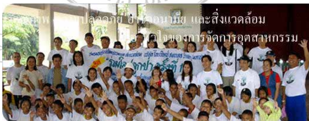
ภาพที่ 3 โครงการ “ไทยน็อกซ์ร่วมใจปลูกป่า”