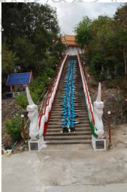
ภาพที่ 20 รวมหมู่กันเมื่อทาสีบันไดพญานาคเสร็จแล้ว