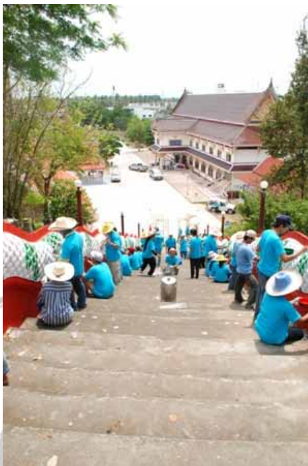
ภาพที่ 19 พนักงานเอสเอสไอกำลังช่วยกันทาสีบันไดพญานาค