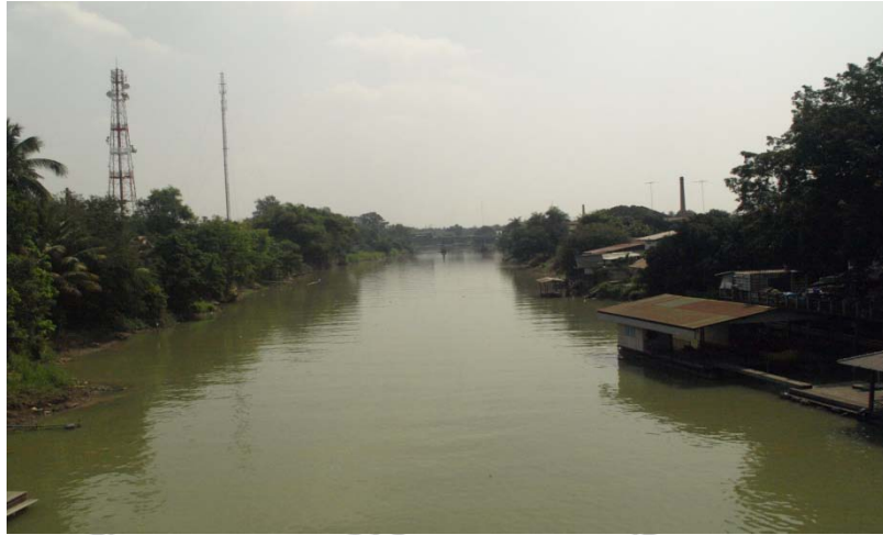
เส้นทางการเดินทางเรือของชาวบ้านสมัยก่อน