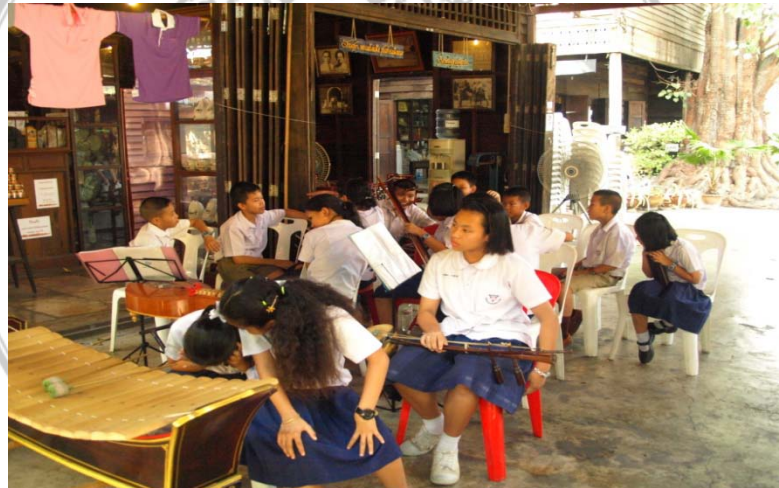
มีนักเรียนมาเล่นดนตรีไทยให้นักท่องเที่ยวฟังเป็นการสืบสานวัฒนธรรม