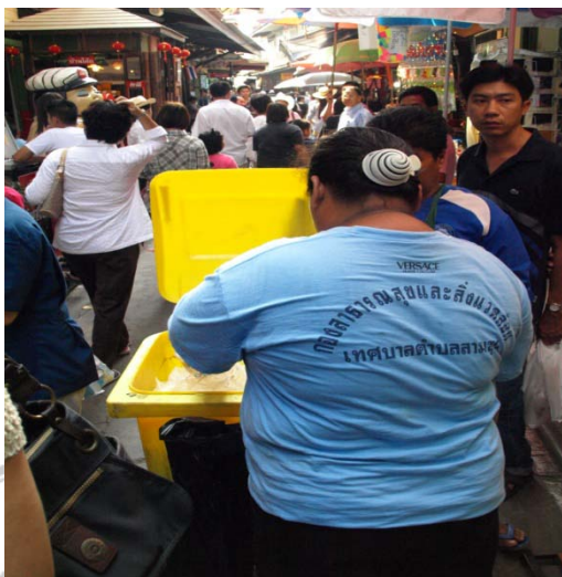
ภาพที่ 6 การกำจัดขยะโดยเทศบาล

คุณสมบูรณ์ ทรัพย์เจริญ กล่าวว่า “การเกิดขึ้นของตลาดชุมชนสามชุกนั้นสามารถนำความเจริญ และสามารถปรับปรุงสิ่งต่าง ๆ เข้ามาในชุมชนเกิดการพัฒนาทางภูมิทัศน์ที่ดีมากขึ้น โดยมีหน่วยงานที่เกี่ยวข้องเข้ามาปรับปรุงภูมิทัศน์ ถนน ไฟฟ้า ประปา ให้ดีขึ้นเพื่อที่จะเป็นหน้าเป็นตาแก่นักท่องเที่ยวที่เข้ามาเยือนด้วย” (สมบูรณ์ ทรัพย์เจริญ สัมภาษณ์เมื่อ 20 กุมภาพันธ์ 2553)