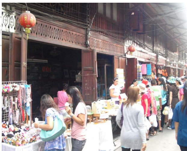
ภาพที่ 4 สภาพตลาดชุมชนสามชุก

คุณรจณี สุขประกอบ กล่าวว่า “เมื่อก่อนดิฉันทำอาชีพรับราชการแต่พอเวลาปลดเกษียณอายุราชการแล้วไม่รู้จะทำอะไรดี เมื่อมีตลาดชุมชนสามชุกเกิดขึ้นมาจึงหันมาลองทำของที่ระลึกไว้ขายแก่นักท่องเที่ยวปรากฏว่าขายดี ทำให้เกิดรายได้เสริมจากเงินบำนาญที่ได้รับ” (รจณี สุขประกอบ สัมภาษณ์เมื่อ 20 กุมภาพันธ์ 2553)