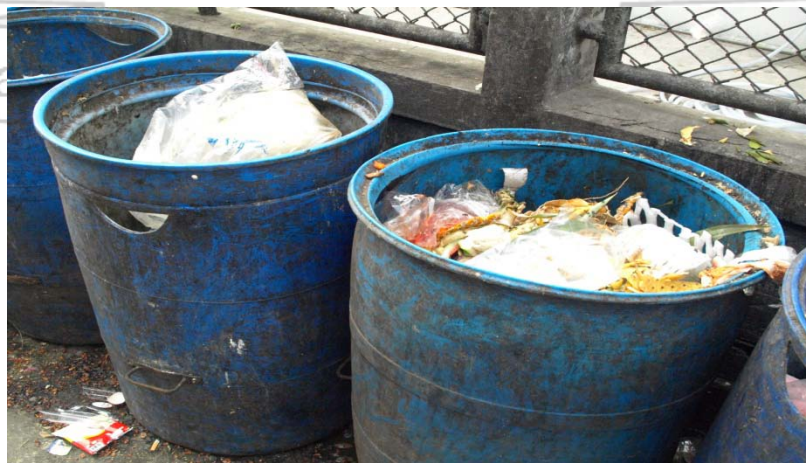
ถังขยะในทั่วตลาดมีขยะจำนวนมาก