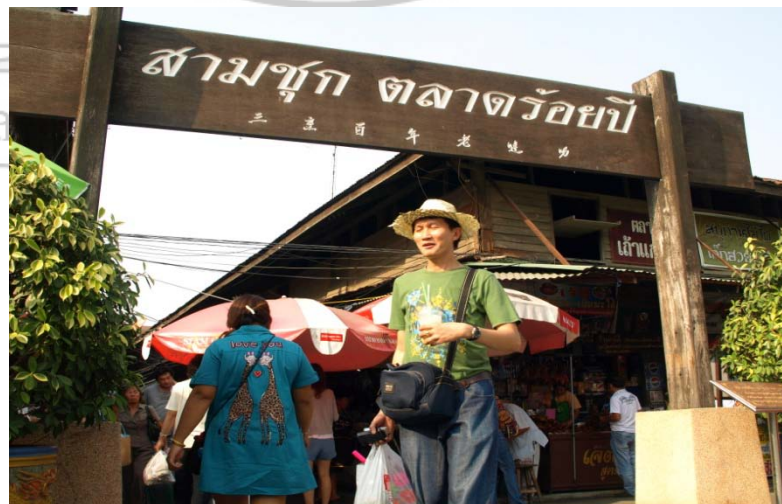
มีการปรับปรุงภูมิทัศน์เพื่อความสวยงาม