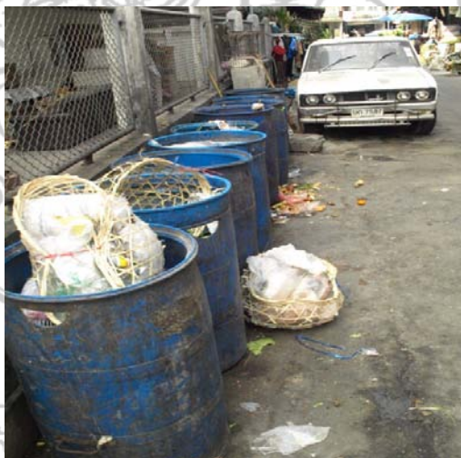
ภาพที่ 7 ขยะของชุมชนตลาดสามชุก

เป็นความจริงประการหนึ่ง คือ เมื่อที่แห่งใดมีคนไปมากขึ้น ปัญหาเกี่ยวกับเรื่องของขยะก็จะเพิ่มมากขึ้นตามมา และเมื่อนักท่องเที่ยวมากขึ้นเท่าใดก็จะส่งผลให้เกิดขยะในชุมชนเพิ่มมากขึ้นตามมาซึ่งปัญหาขยะนำไปสู่การทำให้สภาพแวดล้อมในชุมชนเสื่อมโทรมลง ดังนั้นแล้วทางชุมชนตลาดสามชุกจึงต้องมีการจัดทำโครงการศึกษาแนวทางการจัดการคุณภาพสิ่งแวดล้อมบริเวณชุมชนตลาดสามชุก โดยมีวัตถุประสงค์หลักเพื่อเป็นแนวทางให้แก่ชุมชนและองค์กรท้องถิ่นนำไปใช้และปฏิบัติ และเพื่อเตรียมความพร้อมในการรองรับการท่องเที่ยวที่จะเกิดขึ้นนั้น ได้มีวิธีการบอกให้ชาวบ้านช่วยกันดูแลรักษาความสะอาดในส่วนที่อยู่หน้าบ้านของตนเองโดยใส่ถุงดำทิ้งไว้ เป็นแนวทางในการจัดการขยะเบื้องต้น โดยจะมีรถเก็บขยะของทางเทศบาลเข้ามาเก็บถุงดำที่ชาวบ้านเก็บทิ้งไว้ มีเจ้าหน้าที่หน่วยงานเทศบาลเข้ามาเก็บขยะในพื้นที่ แต่อย่างไรก็ตามเมื่อการท่องเที่ยวขยายตัวเพิ่มมากขึ้น ชาวบ้านและเทศบาลก็ยังคงต้องรับภาระในการกำจัดขยะเหล่านี้ต่อไป