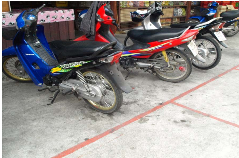
ที่จอดรถมีการตีเส้นเพื่อความเป็นระเบียบ