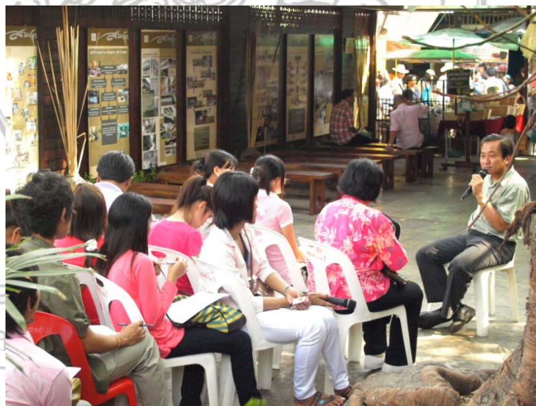
ภาพที่ 5 กิจกรรมการให้ความรู้แก่นักท่องเที่ยว

การท่องเที่ยวช่วยให้ชุมชนเกิดการเรียนรู้ในด้านการจัดการท่องเที่ยว ชุมชนเกิดการรวมกลุ่มทางสังคมของคนในท้องถิ่นซึ่งมีทั้งผู้อาวุโสของชุมชน ปราชญ์ชาวบ้าน ผู้ใหญ่บ้าน กำนันชาวบ้านในชุมชนและเยาวชนที่ระดมกำลังและความสามารถในการจัดกิจกรรมการให้ความรู้ทางสังคมวัฒนธรรมและประเพณีต่าง ๆ ของชุมชนตลาดสามชุก โดยมีเหตุผลทางการท่องเที่ยวเป็นสำคัญ โดยชุมชนได้ระดมความคิดสร้างสรรค์กิจกรรมต่าง ๆ ให้น่าสนใจเพื่อที่จะสร้างความประทับใจให้แก่นักท่องเที่ยวและให้เข้ามาเที่ยวชมชุมชนตลาดสามชุก มากขึ้นทุกปี เช่น การสร้างสังคมวัฒนธรรมให้แก่พ่อค้าแม่ค้า และคนในชุมชนให้มีอัธยาศัยที่ดีงามสร้างความประทับใจให้กับคนที่เข้ามาเที่ยว ตลาดร้อยปี