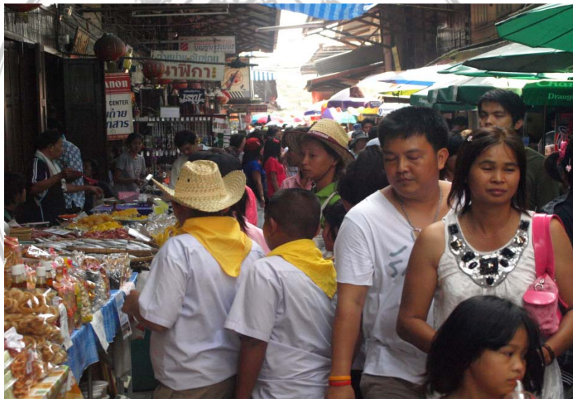
นักท่องเที่ยวจำนวนมากในตลาดสามชุก