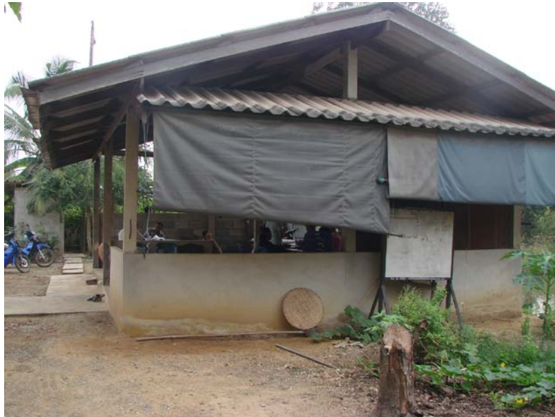
อาคารที่ตั้ง สถานที่ทำการกลุ่มออมทรัพย์เพื่อการผลิตบ้านบางเลนฯ