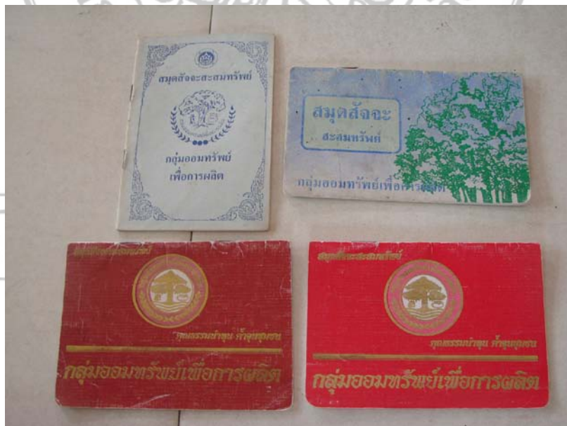
สมุดสัจจะสะสม กลุ่มออมทรัพย์เพื่อการผลิตบ้านบางเลน