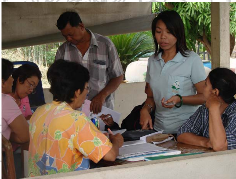
การส่งเงินสัจจะสะสมของสมาชิก วันที่ 5 ธันวาคม 2552 กลุ่มออมทรัพย์เพื่อการผลิตบ้านบางเลน หมู่ 6 ตำบลบางเลน อำเภอบางเลน จังหวัดนครปฐม