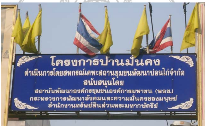
รูปการเก็บข้อมูล