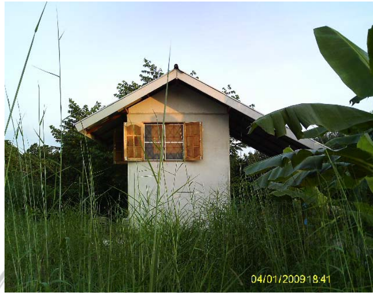
กุฏิพระภิกษุณี