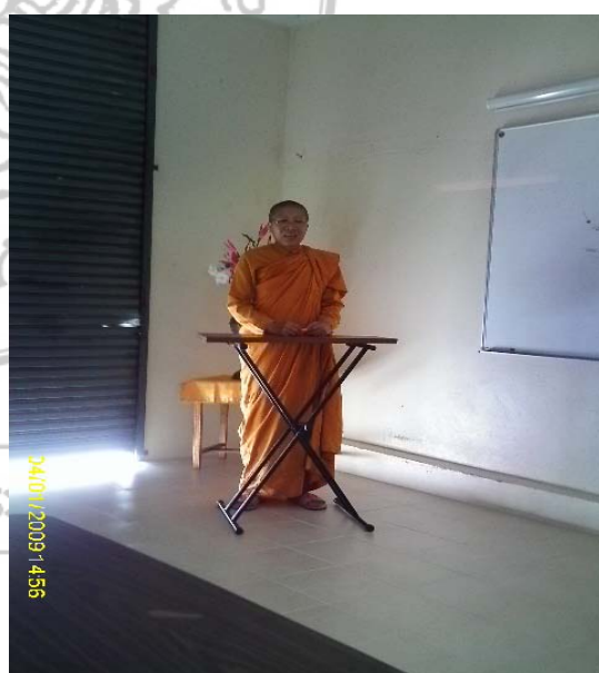
กิจวัตรประจำวันของพระภิกษุณี