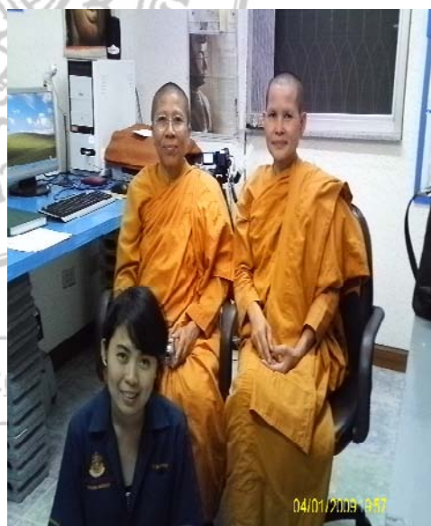
ภาพกิจกรรมการลงพื้นที่ในการเก็บข้อมูลที่ศูนย์ปฏิบัติธรรมแห่งสตรีนานาชาติ จังหวัดระยอง