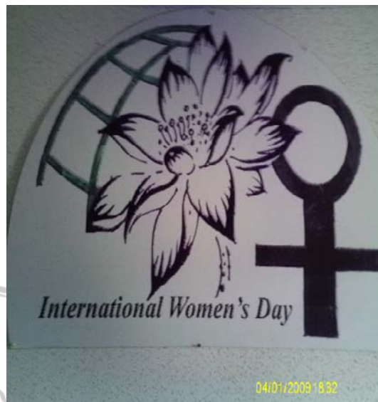
สำนักงาน สัญลักษณ์