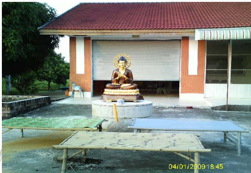
สถานที่ : ศูนย์ปฏิบัติธรรมแห่งสตรีนานาชาติ จังหวัดระยอง