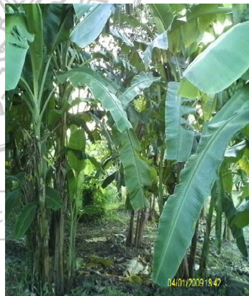
พืชผักสวนครัวในศูนย์ปฏิบัติการแห่งสตรีนานาชาติ จังหวัดระยอง