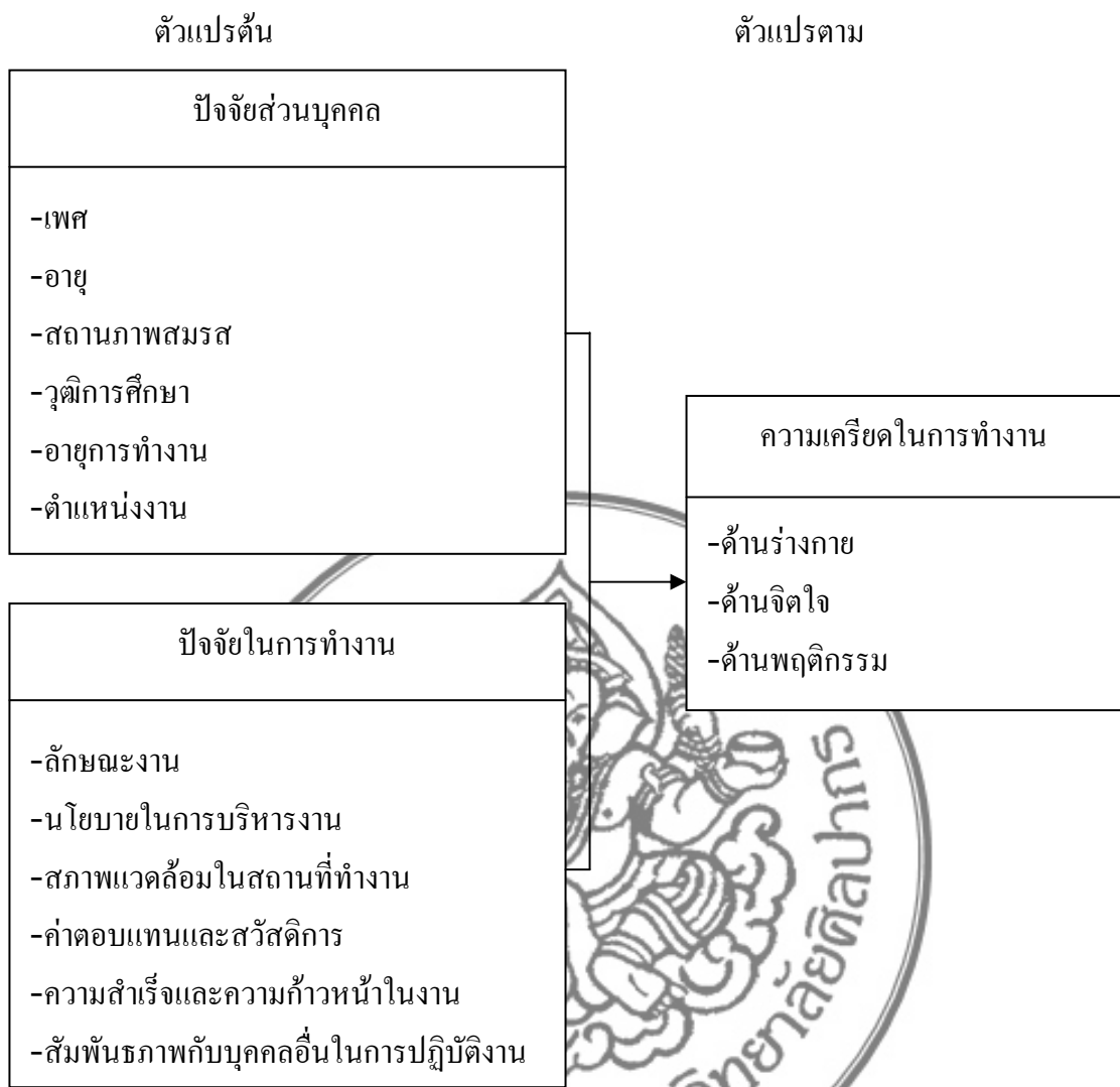
ภาพที่ 1 กรอบแนวความคิดของการวิจัย