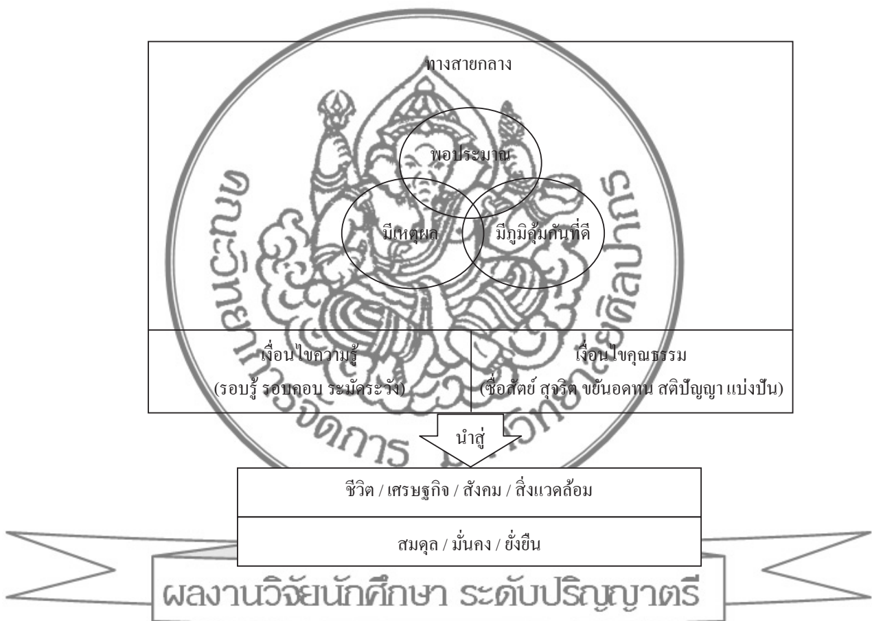
ภาพที่ 1 ปรัชญาของเศรษฐกิจพอเพียง

5. แนวทางปฏิบัติ จากการนำปรัชญาของเศรษฐกิจพอเพียงมาประยุกต์ใช้ คือ การพัฒนาที่สมดุลและยั่งยืน พร้อมรับต่อการเปลี่ยนแปลงในทุกด้าน ทั้งด้านเศรษฐกิจ สังคม สิ่งแวดล้อม ความรู้และเทคโนโลยี