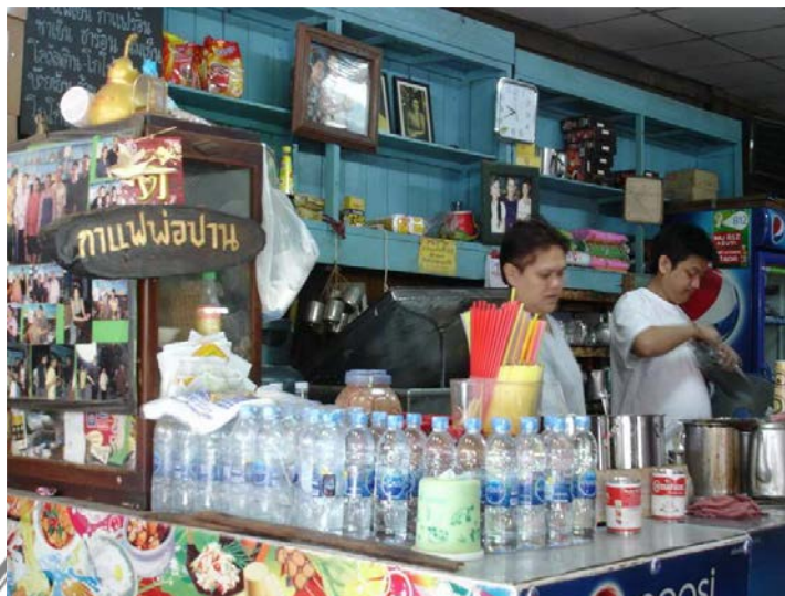
ภาพที่ 10 ร้านกาแฟโบราณ