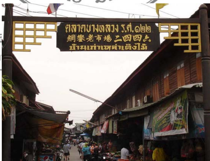
ภาพที่ 1 ตลาดบางหลวง ร.ศ. 122 ปัจจุบัน

ตลาดบางหลวง ร.ศ. 122 เป็นตลาดโบราณที่มีอายุกว่า 100 ปี ตั้งอยู่ที่อำเภอบางเลน จังหวัดนครปฐม มีลักษณะเป็นห้องแถวไม้โบราณ 2 ชั้น ยาวติดกันทั้งสองฟาก ตั้งแต่ถนนถึงแม่น้ำจำนวน 130 ห้อง หรือประมาณ 200 เมตร ซึ่งในปัจจุบันอยู่ในสภาพสมบูรณ์ ถือเป็นอัตลักษณ์เฉพาะอย่างหนึ่งของบางหลวง ห้องแถวไม้ตั้งขนานกับริมแม่น้ำท่าจีน ก่อสร้างโดยมีลักษณะเป็นเหล่าเต็งไม้ ผสมผสานระหว่างวัฒนธรรมไทยและจีน ซึ่งได้รับอิทธิพลมาตั้งแต่สมัยพระบาทสมเด็จพระจุลจอมเกล้าเจ้าอยู่หัว ปัจจุบันตลาดแห่งนี้ยังคงรายล้อมไปด้วยบรรยากาศเก่า ๆ ของร้านค้าที่มีมากกว่า 50 ร้าน มีสินค้าหลากหลายชนิดตั้งจำหน่าย ล้วนทรงคุณค่าในอดีตเช่น หมากฝรั่งมานูหรีตราแมวสีดำ ลูกโป่งวิทยาศาสตร์ และหมากฝรั่งรานกแก้ว ฯลฯ ถูกนำกลับมาวางจำหน่ายอย่างแพร่หลาย ทำให้ตลาดบางหลวง ร.ศ. 122 ปัจจุบันไม่เพียงแต่เป็นตลาดโบราณ ยังเป็นเสมือนพิพิธภัณฑ์ของเก่าที่ควรค่าแก่การอนุรักษ์เป็นอย่างยิ่ง