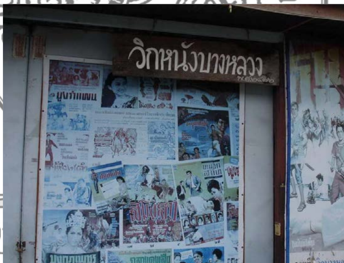
ภาพที่ 3 วิกหนังบางหลวง