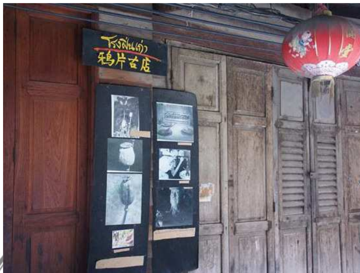
ภาพที่ 4 โรงฝิ่น