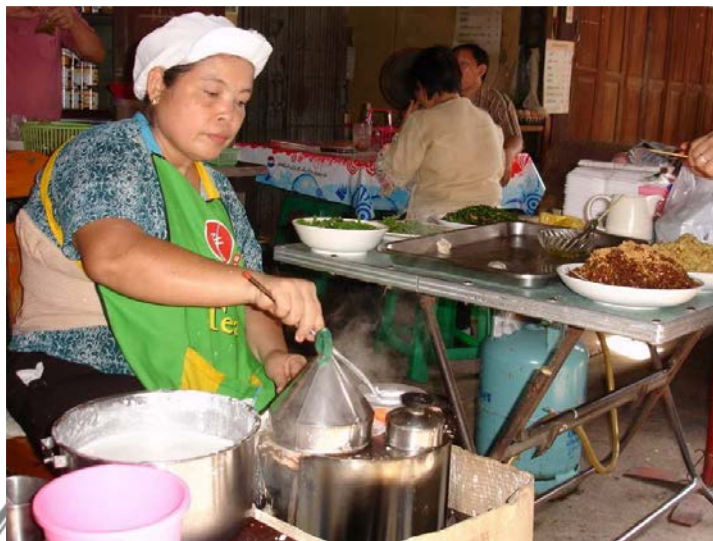
ภาพที่ 8 ร้านข้าวเกรียบปากหม้อ