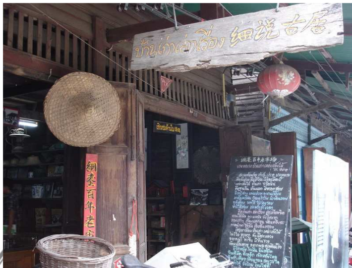
ภาพที่ 2 พิพิธภัณฑน์บ้านเก่าเล่าเรื่อง