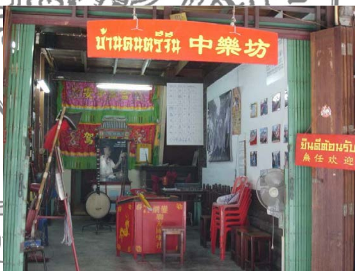
ภาพที่ 5 บ้านดนตรีจีน