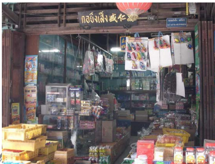
ภาพที่ 12 ร้านขายของชำ

จากข้อมูลข้างต้นสรุปได้ว่า ตลาดบางหลวง ร.ศ. 122 ตั้งแต่อดีตจนถึงปัจจุบัน เกิดการเปลี่ยนแปลงต่าง ๆ มากมายทั้งในด้านการค้าขายและวิถีชีวิต ทั้งนี้สืบเนื่องมาจากการพัฒนาการคมนาคมทางบก และการผันผวนทางเศรษฐกิจ ด้วยเหตุนี้จึงส่งผลให้ตลาดบางหลวง ร.ศ. 122 กลายเป็นตลาดที่ซบเซา ทำให้ร้านค้าหลายร้านต้องปิดกิจการลงและบางร้านโยกย้ายไปหาทำเลการค้าแห่งใหม่ ในขณะที่บางร้านยังคงทำการค้าขายเช่นเดิม จนกระทั่งปี พ.ศ. 2551 ตลาดบางหลวง ร.ศ. 122 กลับมาเป็นที่รู้จักอีกครั้ง เนื่องจากมีละครมาถ่ายทำที่ตลาดบางหลวง ร.ศ. 122 มีสื่อนำเสนอเรื่องราวต่างๆ เกี่ยวกับตลาดบางหลวง ร.ศ. 122 ส่งผลให้เศรษฐกิจการค้าภายในตลาดบางหลวง ร.ศ. 122 มีทิศทางที่ดีขึ้น ตลาดบางหลวง ร.ศ. 122 เริ่มคึกคักและกลับมามีชีวิตชีวาอีกครั้ง