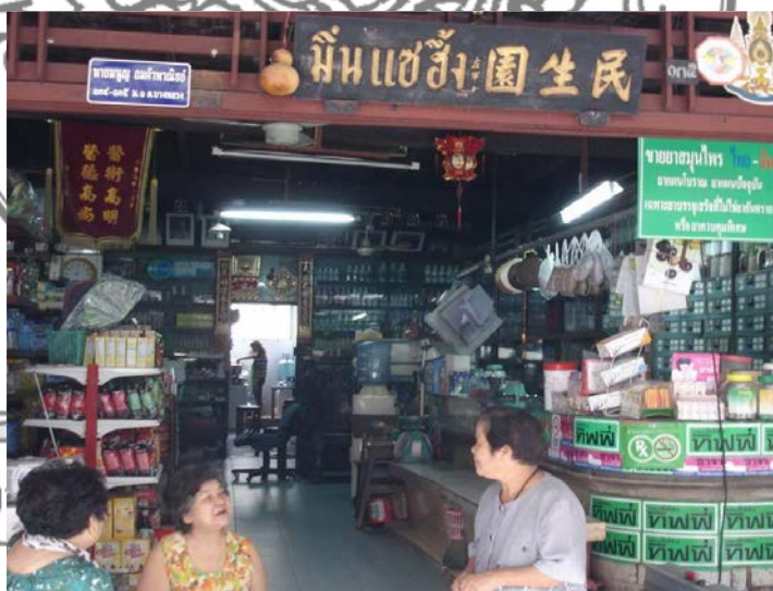
ภาพที่ 11 ร้านขายยาจีน