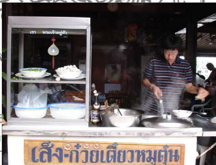
ภาพที่ 7 ร้านเส็งก้วยเตี่ยวหมูตุ๋น