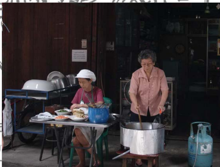
ภาพที่ 9 ร้านซุนเปี้ยะทอด