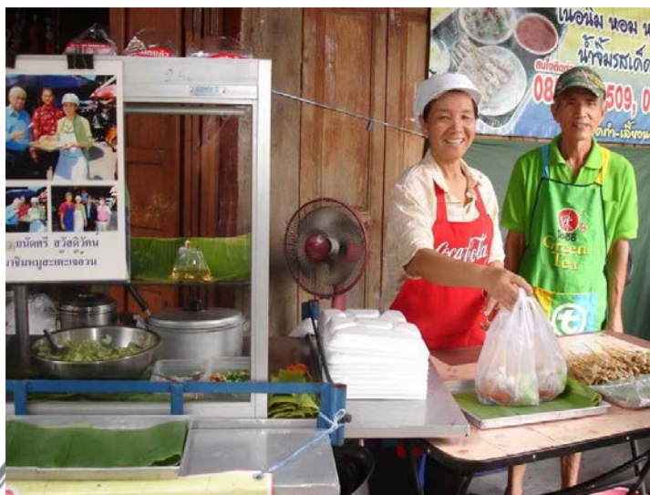
ภาพที่ 6 ร้านหมูสะเต๊ะ