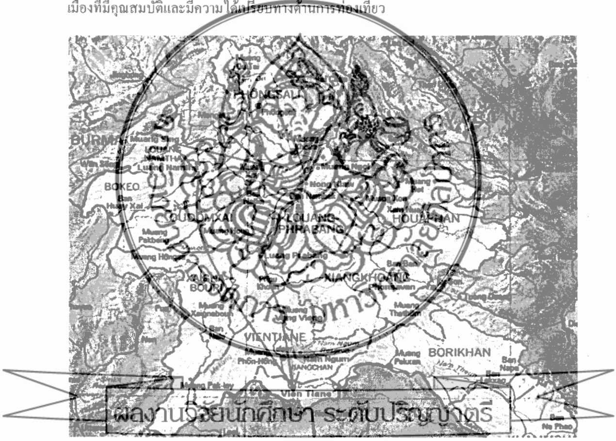
ภาพที่ 1 แผนที่เส้นทางการท่องเที่ยว จากแขวงเวียงจันทน์ไปยังเมืองหลวงพระบาง

ประเทศในอินโดจีนเรียกว่า "เส้นทางสายอาณานิคมที่ 13" เริ่มจากเมืองไซ่ง่อน ผ่านเข้ากัมพูชา และตัดขึ้นสู่ลาวที่เมืองคอนของจนไปสิ้นสุดที่เมืองหลวงพระบาง นับเป็นเส้นทางสำคัญที่สุดในดินแดนอาณานิคมอินโดจีนของฝรั่งเศส โดยใช้เวลาเดินทางจากนครเวียงจันทน์ประมาณ 4 ชั่วโมง ระยะห่างจากนครหลวงเวียงจันทน์ระยะทาง 160 กิโลเมตรโดยประมาณ เป็นจุดแวะพักระหว่างการเดินทางของ 2 เมืองท่องเที่ยวคือหลวงพระบางและเวียงจันทน์ วังเวียงมีสภาพที่ตั้งอยู่ในหุบเขา ริมแม่น้ำซอง มีภูมิทัศน์ที่สวยงามด้วยยุทธศาสตร์ทางการท่องเที่ยวที่ตัวเอง วังเวียงจึงเป็นเมืองที่มีคุณสมบัติและมีความได้เปรียบทางด้านการท่องเที่ยว